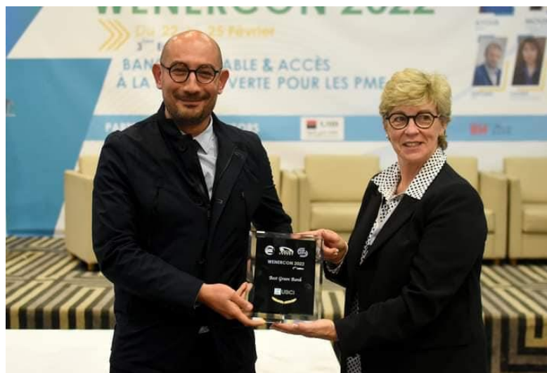
Best Green Bank : 3 ème Prix UBCI