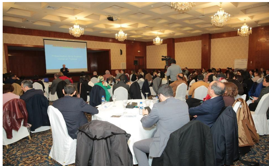
Le renforcement de la gouvernance climatique dans le secteur bancaire et financier et l'établissement d'une taxonomie durable.