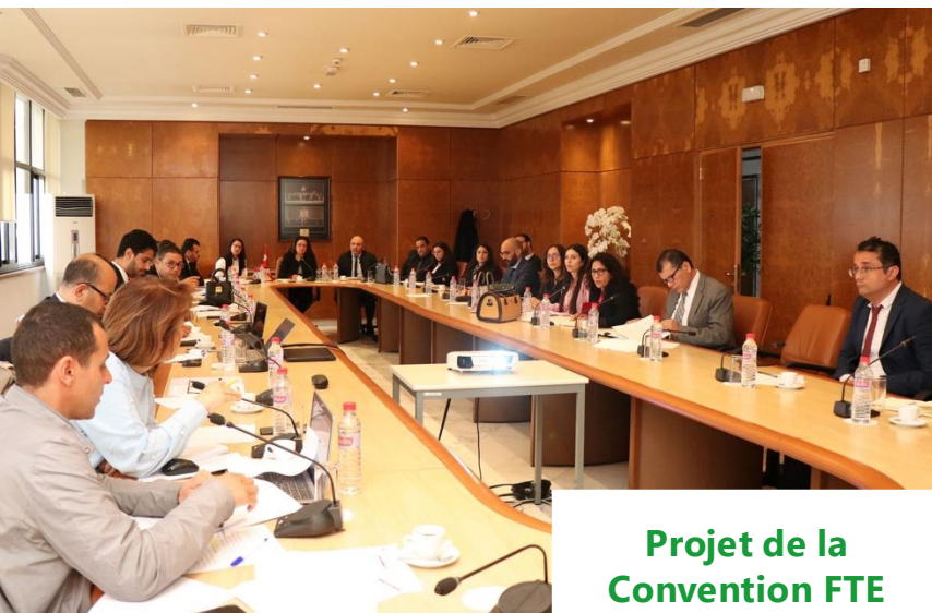
Projet de la Convention FTE