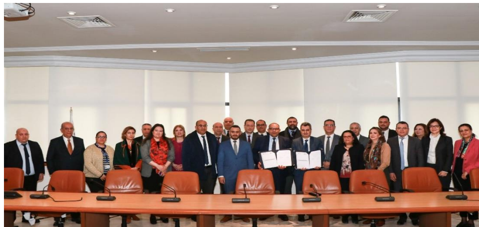
CBF et l'ANME unissent leurs Forces pour la Transition Énergétique