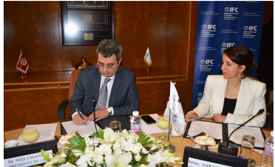
L'intégration des critères iESG-IFC