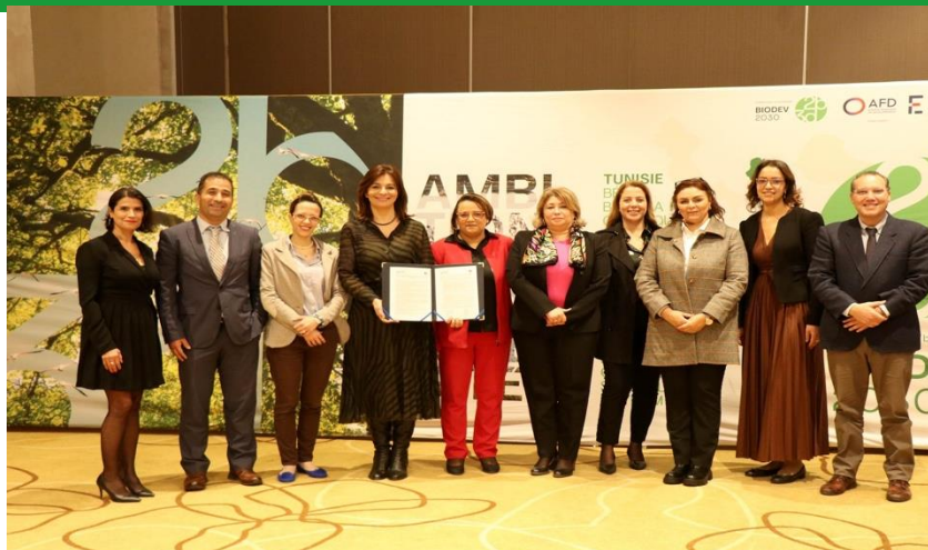
Projet de la biodiversité 2023-2027 Le Seul secteur bancaire dans 16 pays qui a signé la Charte d'engagement volontaire pour la préservation de la biodiversité