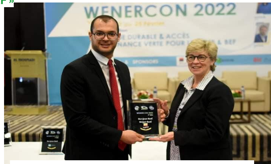
Best Green Bank : 2 ème Prix Attijari Bank