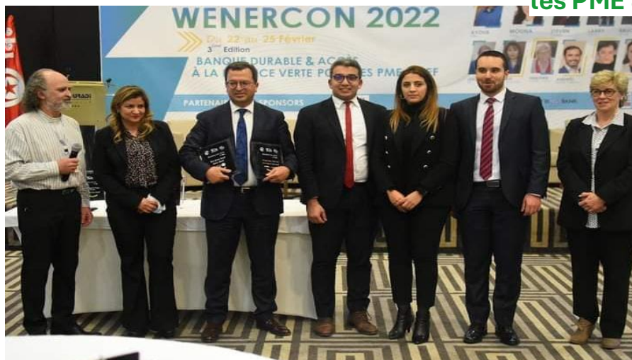
Best Green Bank : 1er Prix : Amen Bank