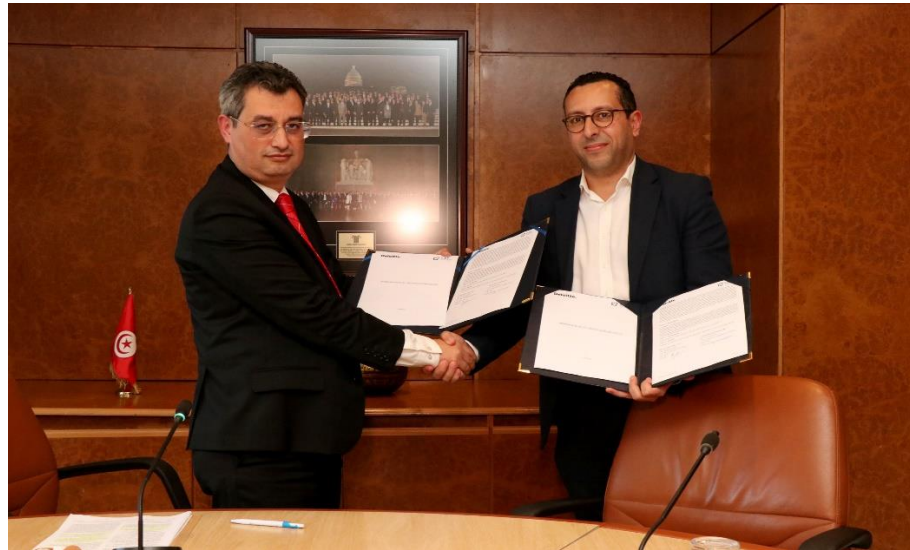
Lancement d'une Étude Approfondie